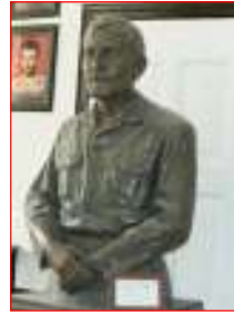
مجسمه شهید مهندس مهدی باکری