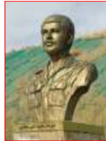
تندیس سردار شهید علی تجلابی از فرماندهان دلاور سوسنگرد