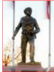
مجسمه شهید محمد حسین فهمیده