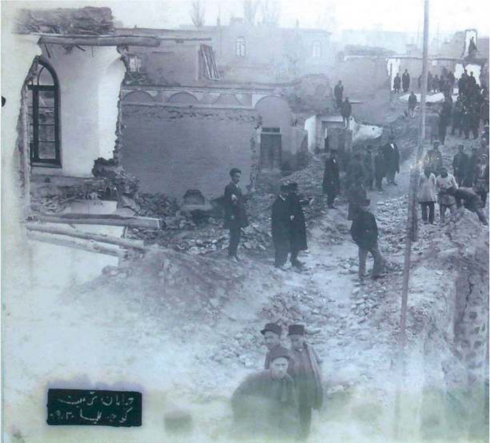
جوامان سر هیت کوردلیا ۱۹۲۰