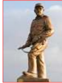
مجسمه شهید دکتر مصطفی چمران