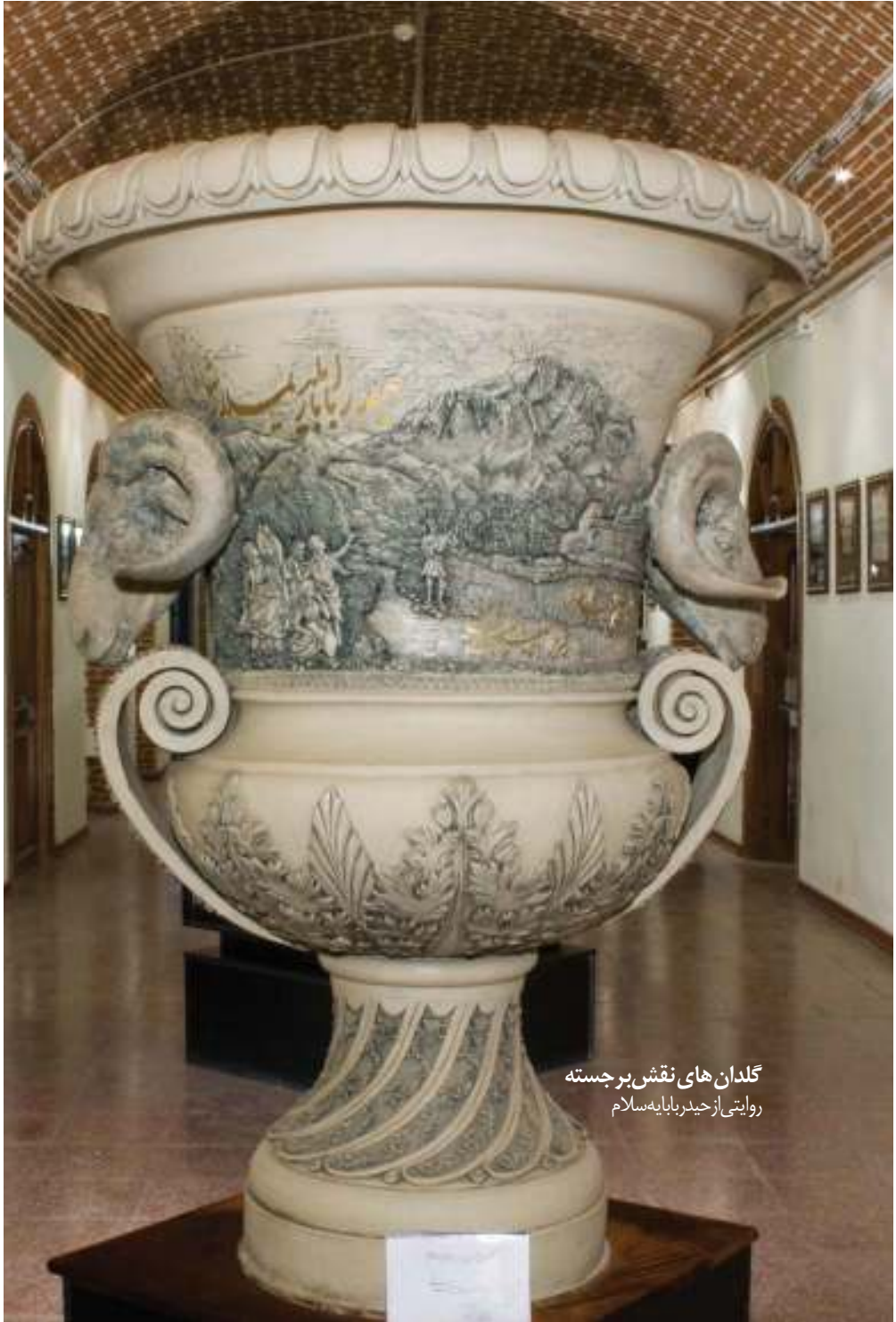
گلدان های نقش برجسته روایتی از حیدر بابا به سلام